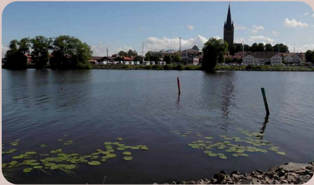
Sett från Ekudden 2020-08-04: den gamla skolan och domkyrkan.

staterar han att de är mer frispråkiga än under hans rektorstid.