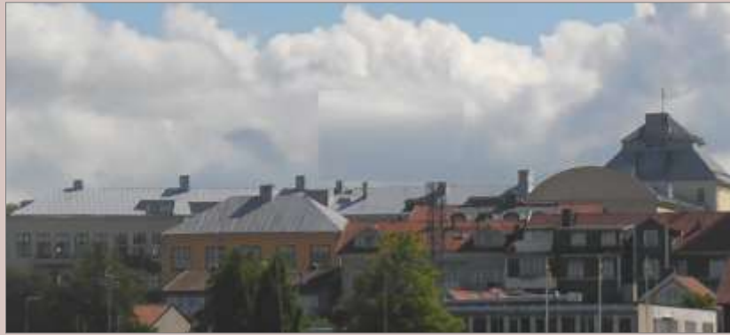
Sett från Ekudden: Den gamla skolan uppe på höjden - numera bostadsrättsförening. Foto 2020-08-04