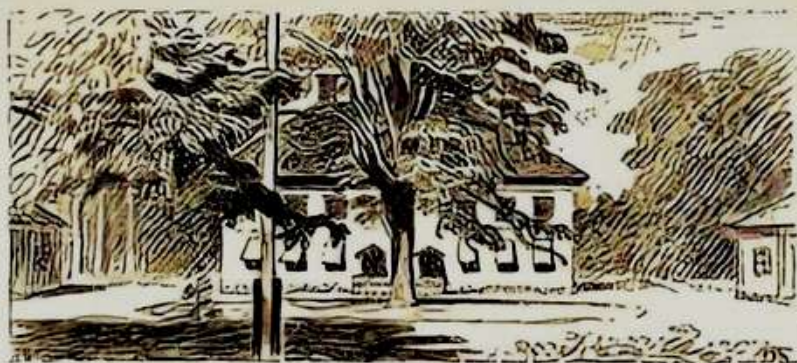
Skagersholms herrgård sommartid. Teckning 1944 av Frans Timén.

Jag kommer att ha Finnerödjaboken till hands och det första klippet handlar om det äldsta Skagersholm eller Skageholm som danska inkräktare kallade stället. Skagersholm var inte bara störst. Man var först med att ha en fast befolkning i den framtida socknen Finnerödja.