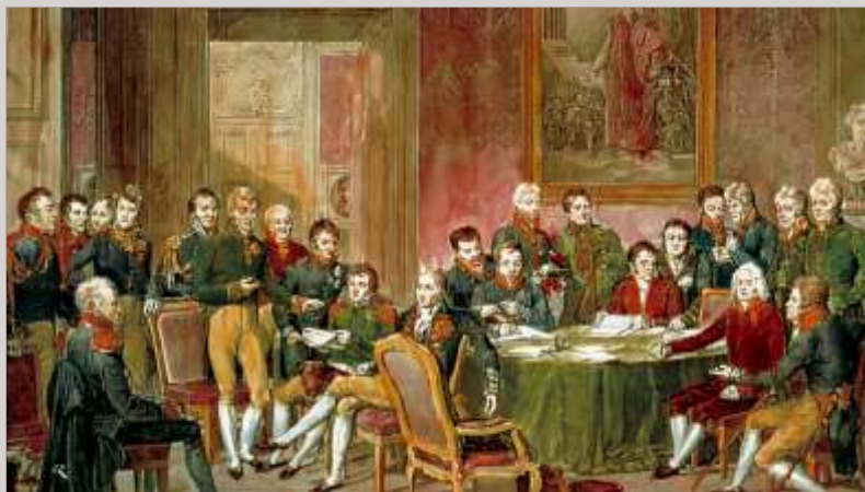
Wienkongressen. Målning av Jean-Baptiste Isabey.