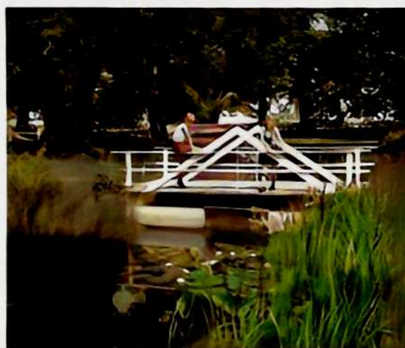
Slagsmålsån går i en båge utav omlängs herrgården. Här så pojkarne Ove och Georg på en av de färre runda 1800-talensvarns canaler ett stort vitt näckrosor.