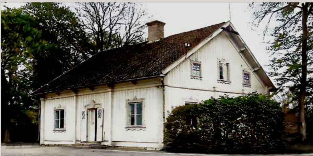
Den sydöstra flygeln,