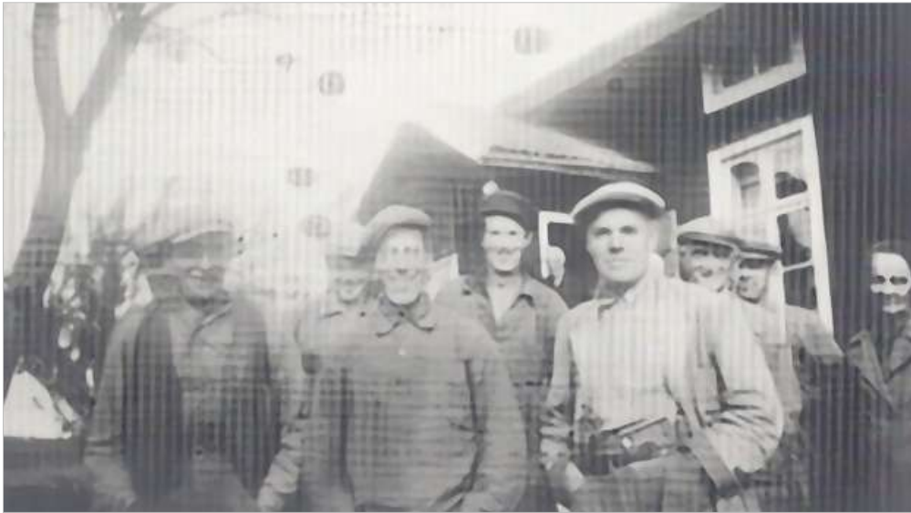
Ett helt trösklag framför Wärns stuga.