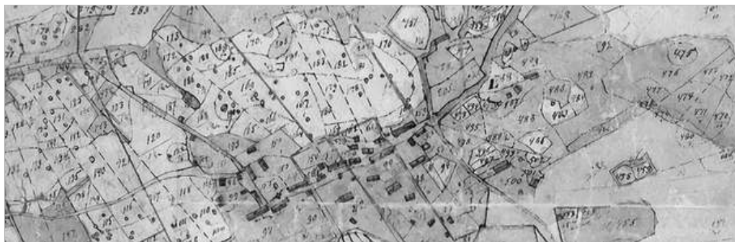
Tilläggsbild: Laga skifteskarta från 1851. Barruds centrum.

Verktygen som används i skogsarbetet är enkla och här, liksom i jordbruksarbetet, är det den egna kroppsarbetsinsatsen som bestämmer hur mycket det ska bli gjort under en dag. När Barrudsbonden går till skogen, har han yxan i ena handen, sågen över axeln och lite matsäck i den andra handen. Det är vad han behöver för sitt dagsverke i skogen.