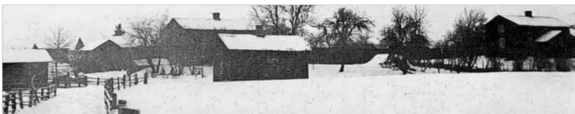
Vinter i Barrud på 1920- talet.

Skog har man gott om i Barrud. Drygt 90 procent av markarealen är skogbevuxen. Men det är inte så stor efterfrågan på virke och massaved vid den här tiden, så den skog. man avverkar går mest till kolved och ved till spisar och kakelugnar.