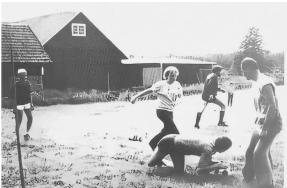
Fotboll i Barrud. Observera att fönstren fortfarande är hela.