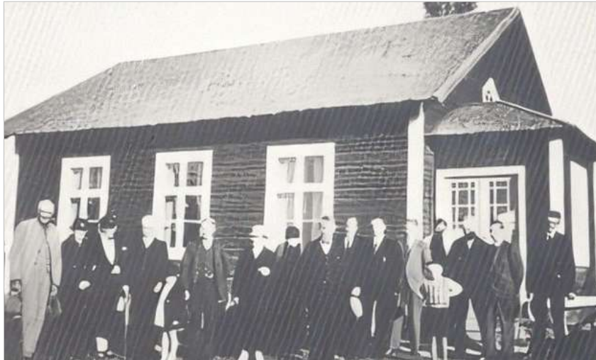
Uppställning vid Bönehuset i början av 1940- talet.