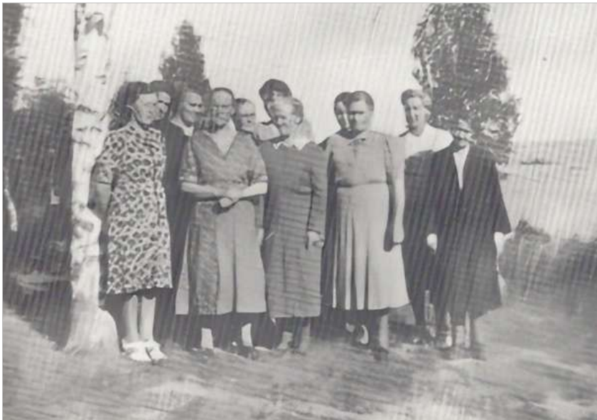
Uppställning vid Notängen. Damkalas.