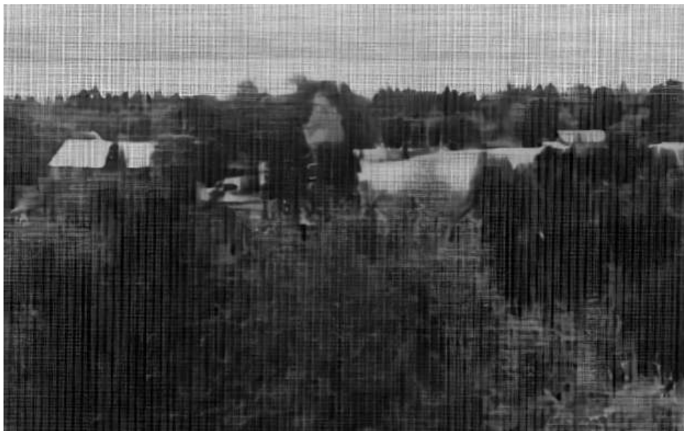
Barruds by, med Unden och Tiveden i bakgrunden.

I slutet av 1700- talet försökte man starta tillverkning av kvarnstenar vid Kvarnstensbergen, som ligger mellan Barrud och Slottsbolet, nära den så kallade Drottning Kristinas ridväg. Hon lär ha ridit denna väg från Gudhammar till Ramsnäs. Hon var myndig drottning i Sverige åren 1644—1654. Senare planerades ett stickspår mellan bergen och Gårdsjö. Stenarna var dock för hårda och av storföretaget blev intet. Minnen från denna tid är en del stenblock som ligger kvar vid bergen samt den kvarnsten som ligger vid rastplatsen vid 6 -an, där Bergabacken börjar. Den stenen fungerar som bord.