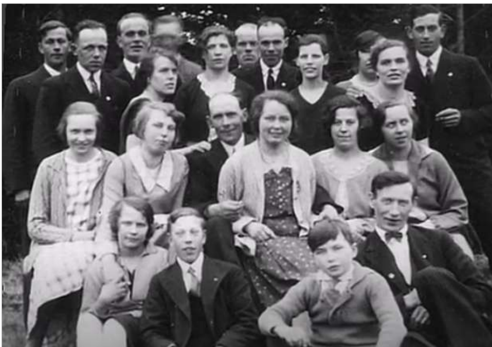
Barruds ungdomar samlade vid Unden,