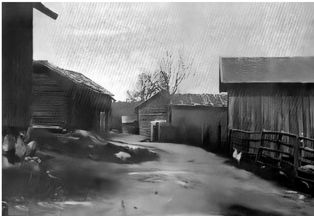
Bygatan i Barrud på 1910- talet.