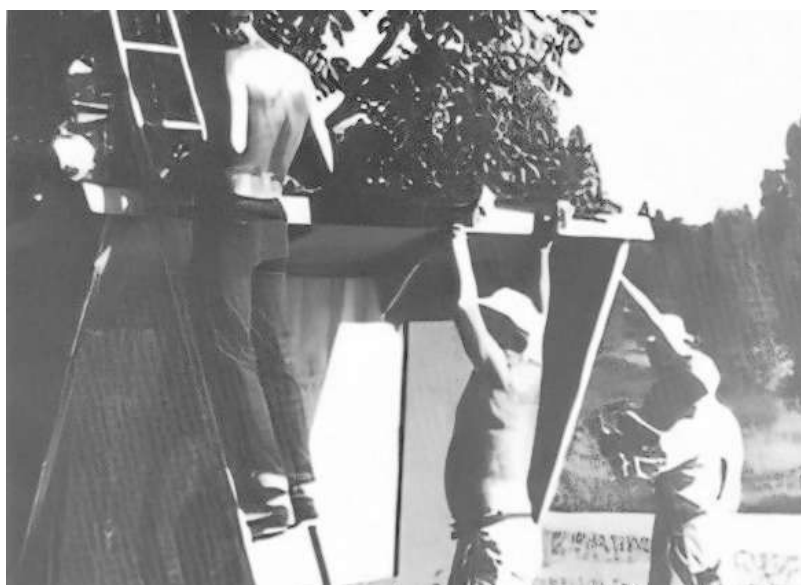
Gemensam verksamhet 1982: Postverk.