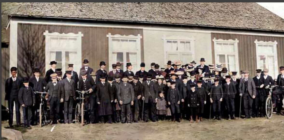
Framför missionshuset i Finnefallet.