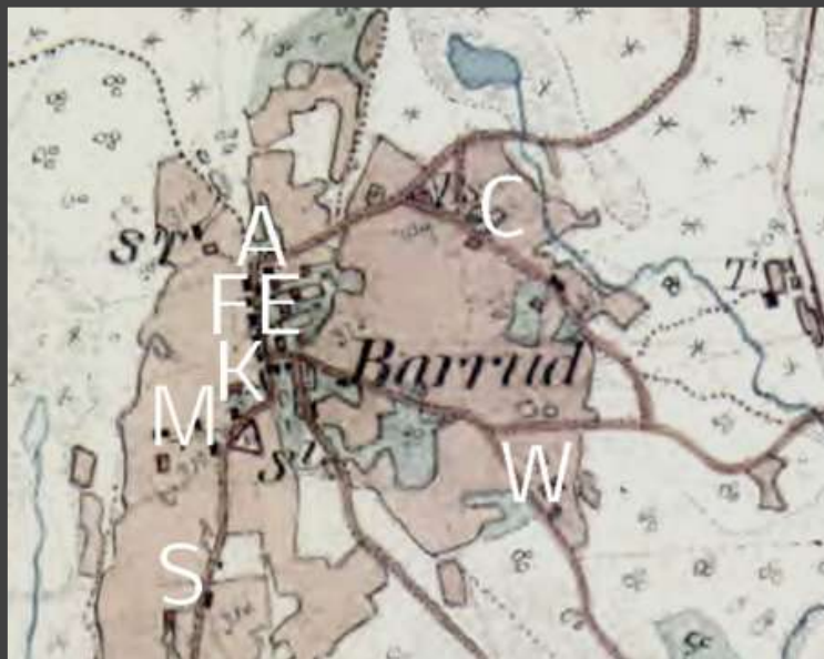
Häradsekonomisk karta från 1877- 82.

Barruds by under 1900- talets första hälft: