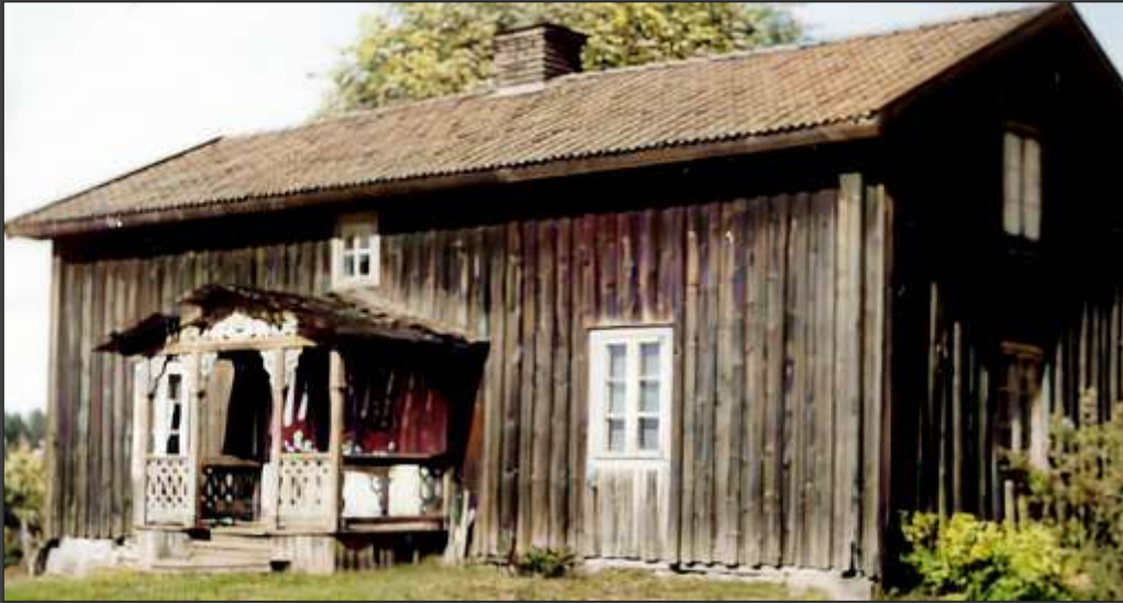
Franssons bostadshus fram till 1950- talet. Här nere: Utsnitt, husets veranda.