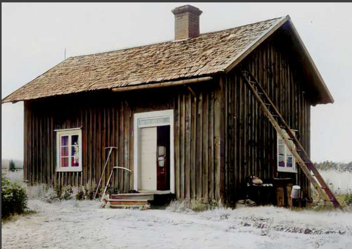
Soldatens stuga i Barrud.