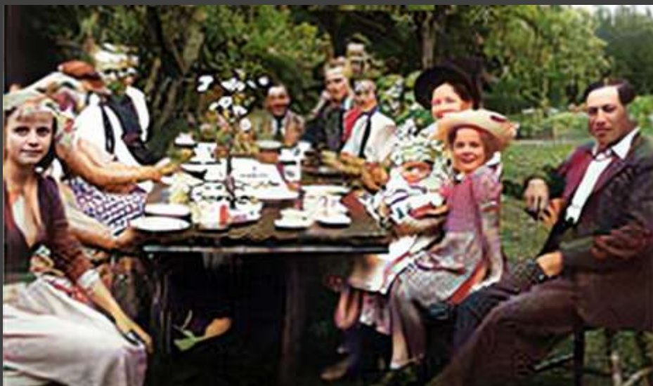
Hos familjen Andersson.