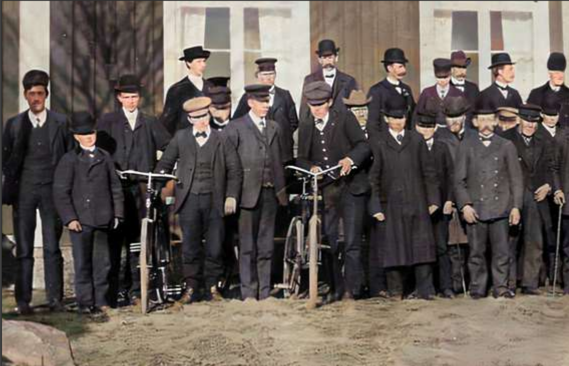
Fortfarande Finnefallet, från förra sidan.