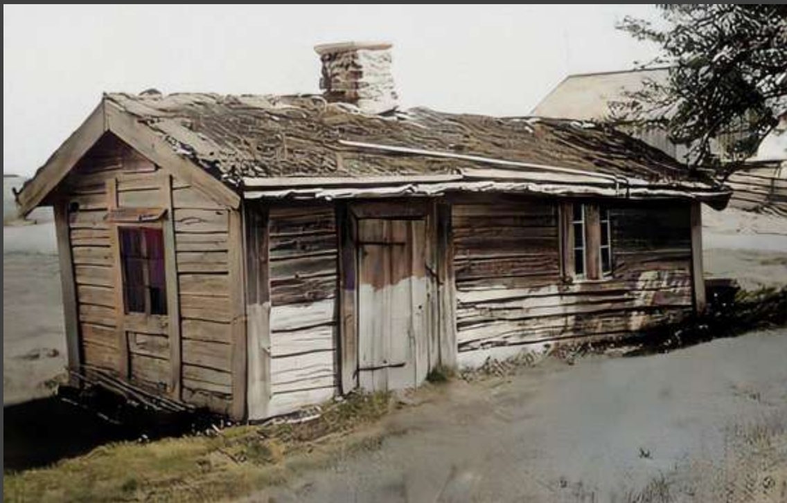
Bryggghus i Barrud.