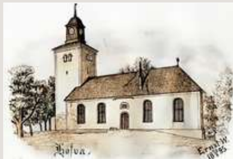
Prästgården (observera velocipeden) och kyrkan i Hova.