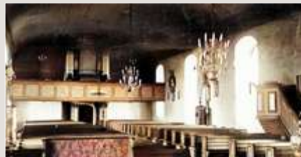
Vigsellärdaren, kyrkoherde Ernst Lexell och kyrkans interiör.

Det skulle sitta bra med ett foto av bruden Hildur Elisabet.