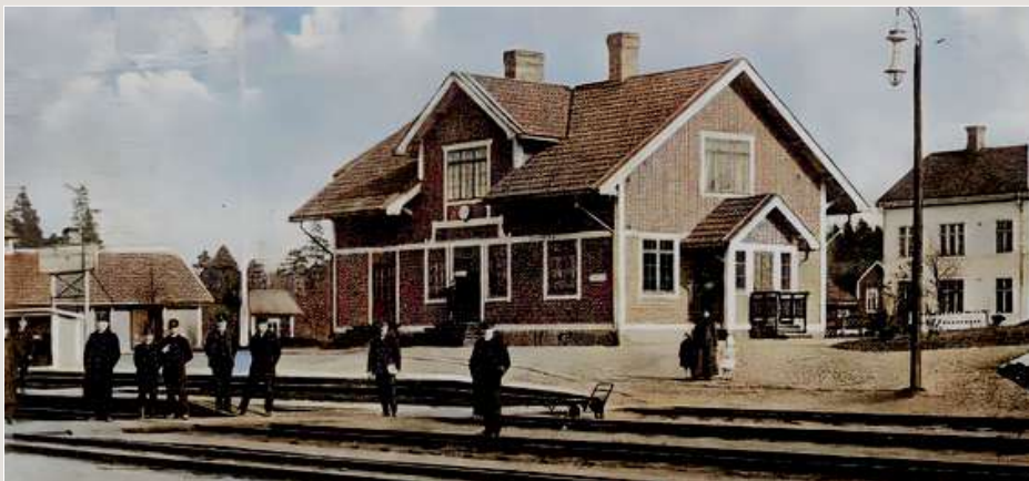
Stationen och personal 1910. Hotellet i bakgrunden.