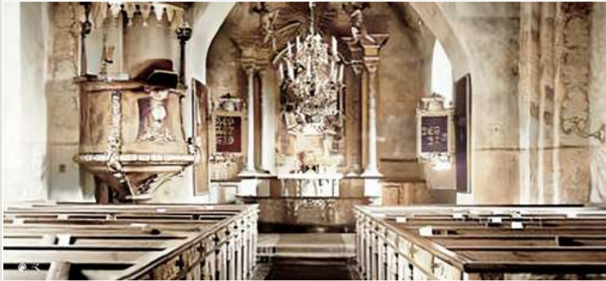
Kyrkan invändigt i äldre tider här uppe. Nere. Ute och inne i nutiden.