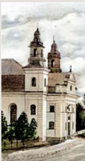
Ockelbo kyrka (2).

Ärkebiskopen tog verksam del i hjälparbetet. Ett urval av hans brev från denna period belysa hans glänsande egenskap som organisatör. Den första avdelningen i denna brevsamling rör sig om hjälpexpeditionens resa till Gammal-Svenskby och de svårigheter och förvecklingar som det gällde att bekämpa. Ett, daterat Uppsala den 24 november 1921, lyder i utdrag: