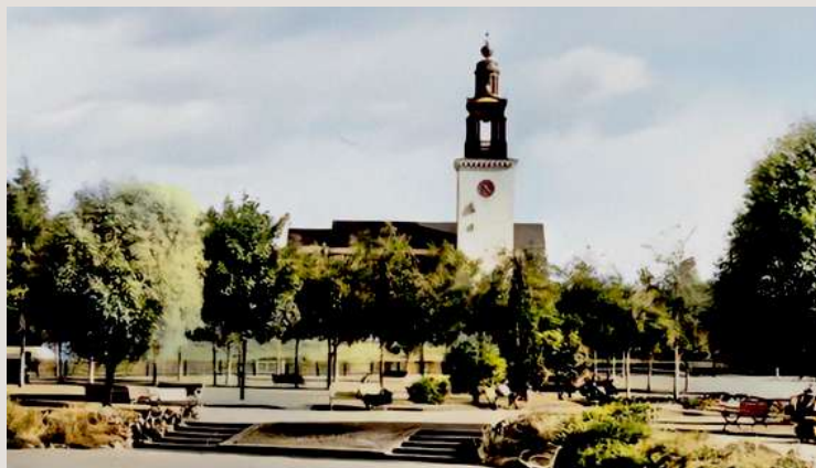
Herman Neanders (Staffans) kyrka 1934- 51.