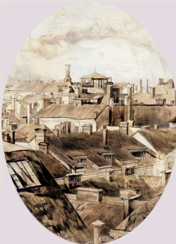
Axel Fridell: Tak i Stockholm I (1932). Färg genom min försorg.