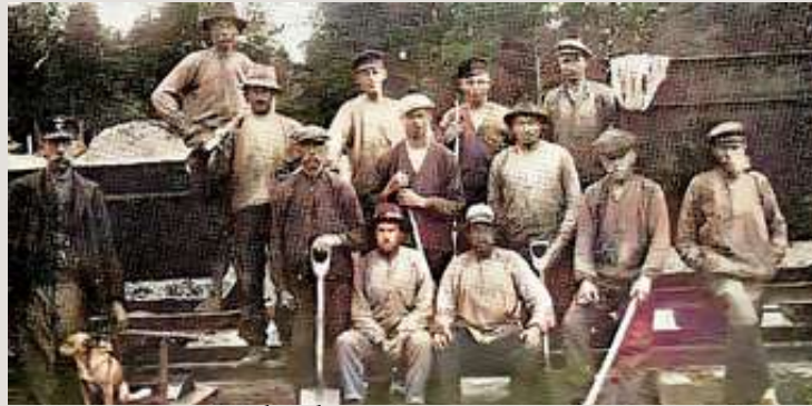
Arbetslag på stationen 1917.