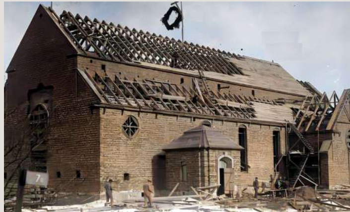
Kyrkans grundsten lades hösten 1930 av ärkebiskop Nathan Söderblom. Här: taklagsfest 1932.

Kyrkobyggnader brukar ofta ha medeltida rötter. Så inte Staffans församlingskyrka i Gävle.