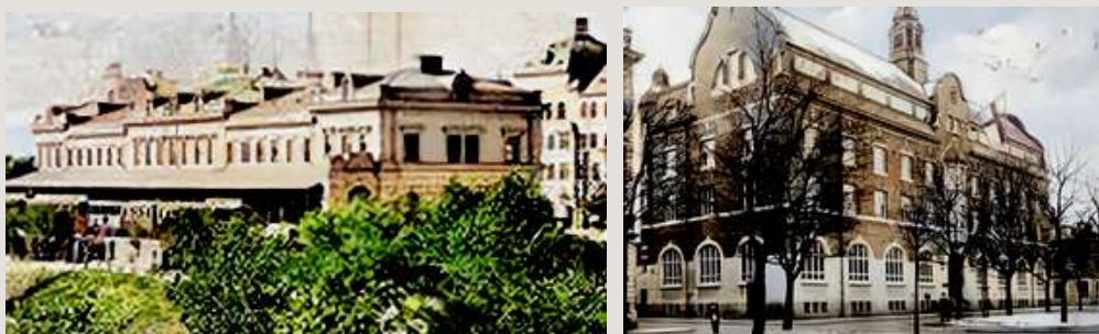
SJ centralstation och Posten.

Staffans kyrka ligger i Brynäs och familjen Neander hade sommarställe i Leksand. Varning för ishockey- kollision. Fast hockey var inte någon stor sport vid den tiden. Visserligen var Gävle Godtemplare tidiga med denna sport - om jag minns rätt från Rekordmagasinet. Men vid den tiden spelade man fotboll på somrarna och bandy på vintern.