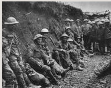
Slaget vid Sommes avslutades i november 1916.