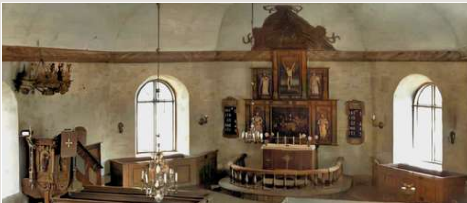
Finnerödja kyrka förr.

Anmärkning: Den ålder (XX) de uppnådde det år som modern avled.