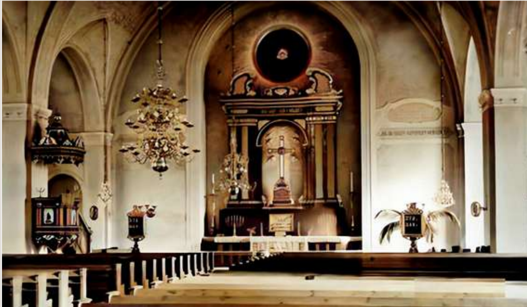
Interiör: Ockelbo kyrka.

Från Ockelbo i Gästrikland: en avstickare till Gårdsjö och Västergötland.