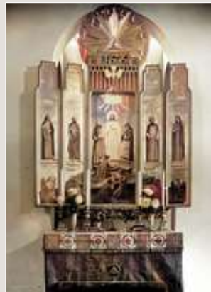
Kyrkan invigdes 1932 av ärkebiskop Erling Eidem. Arkitekt: Knut Nordenskjöld.