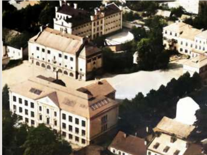
Karolinska läroverket och där bakom stadens fängelse.

Underlag: vykort och ur Örebro stadsarkiv.