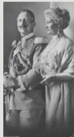
Kejsarparet Vilhelm II och Auguste Viktoria (o. 1910).