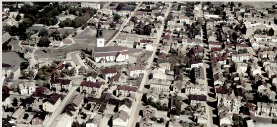
Församlingen omfattade Gävle-stadsdelarna Brynäs, delar av söder, Södertull, Hemsta och byarna Järvsta, Mårtsbo, Furuvik och Ytterharnäs.