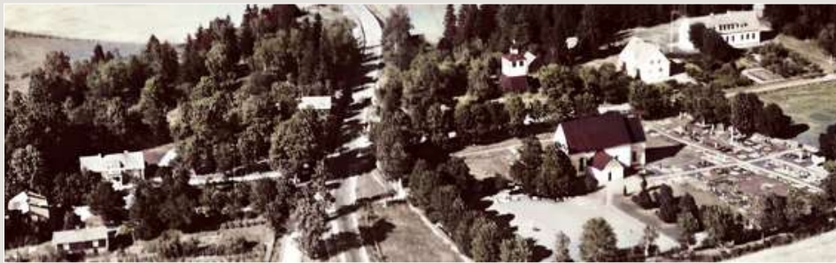
Socknens centrum, med kyrka, prästgård och skola.