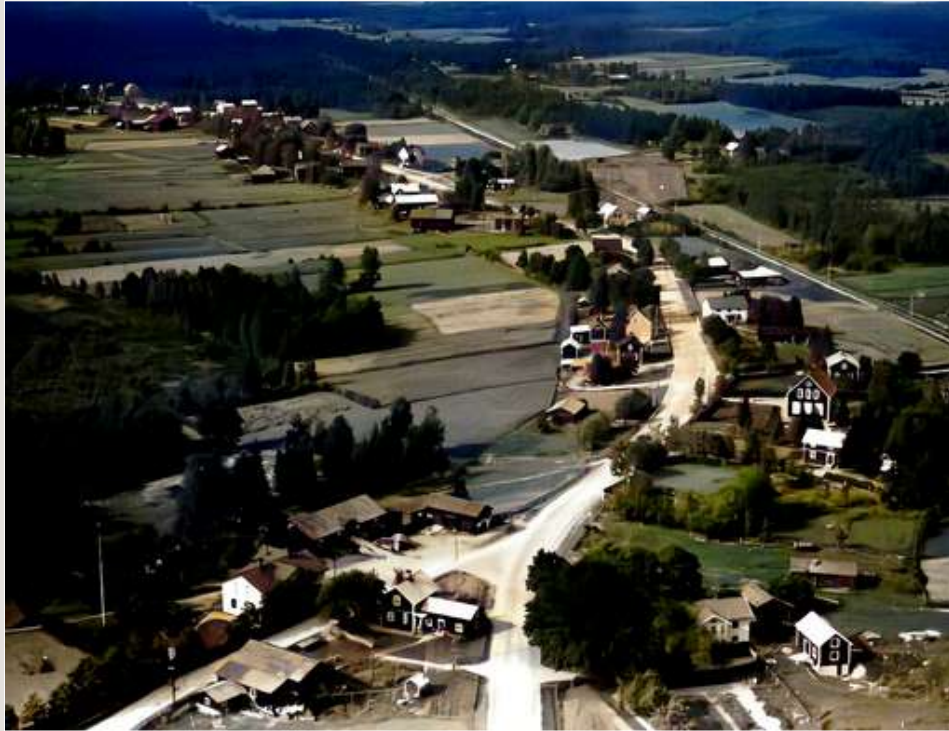
Säbyggeby i Ockelbo socken.