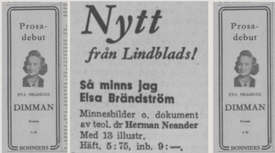
T. v. och t. h: april 1946. Mitten: April 1949.