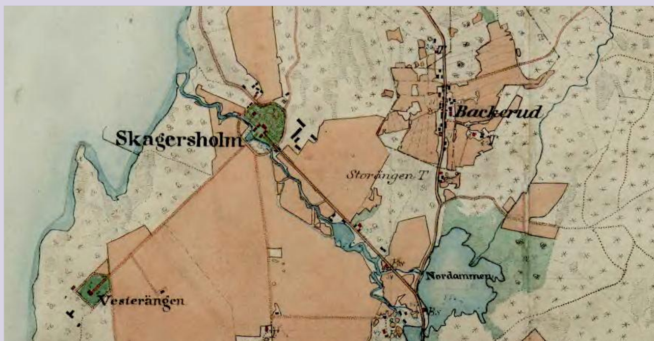
Häradseconomisk karta från omkr. 1880. Skagersholm och Västerängen, med mera.