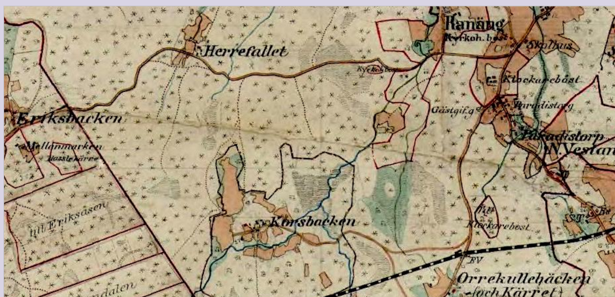
Häradsekonomisk karta från omkr. 1880. Nytorp ligger mellan Korsbacken och Ranäng.