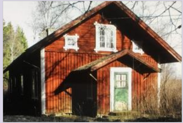
Vilket vackert hus i Västeräng!