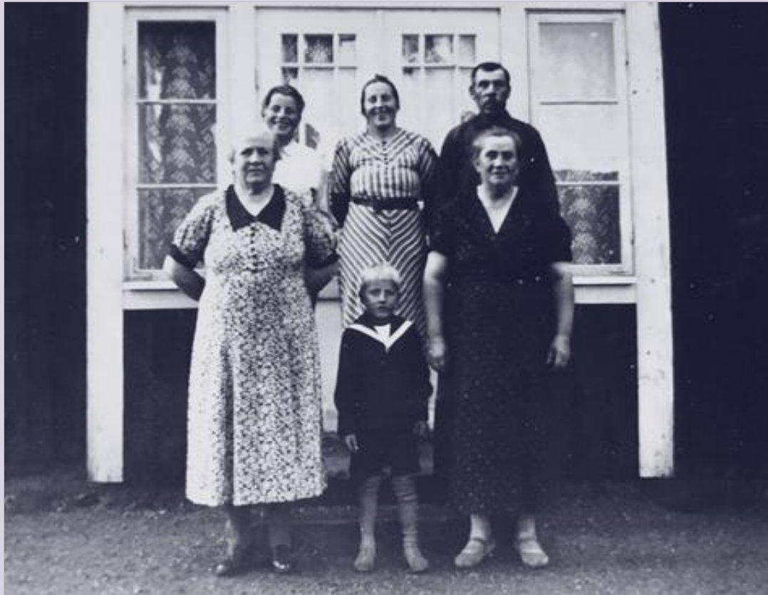
Familjebilder [3] i Nytorp och Kolarstugan