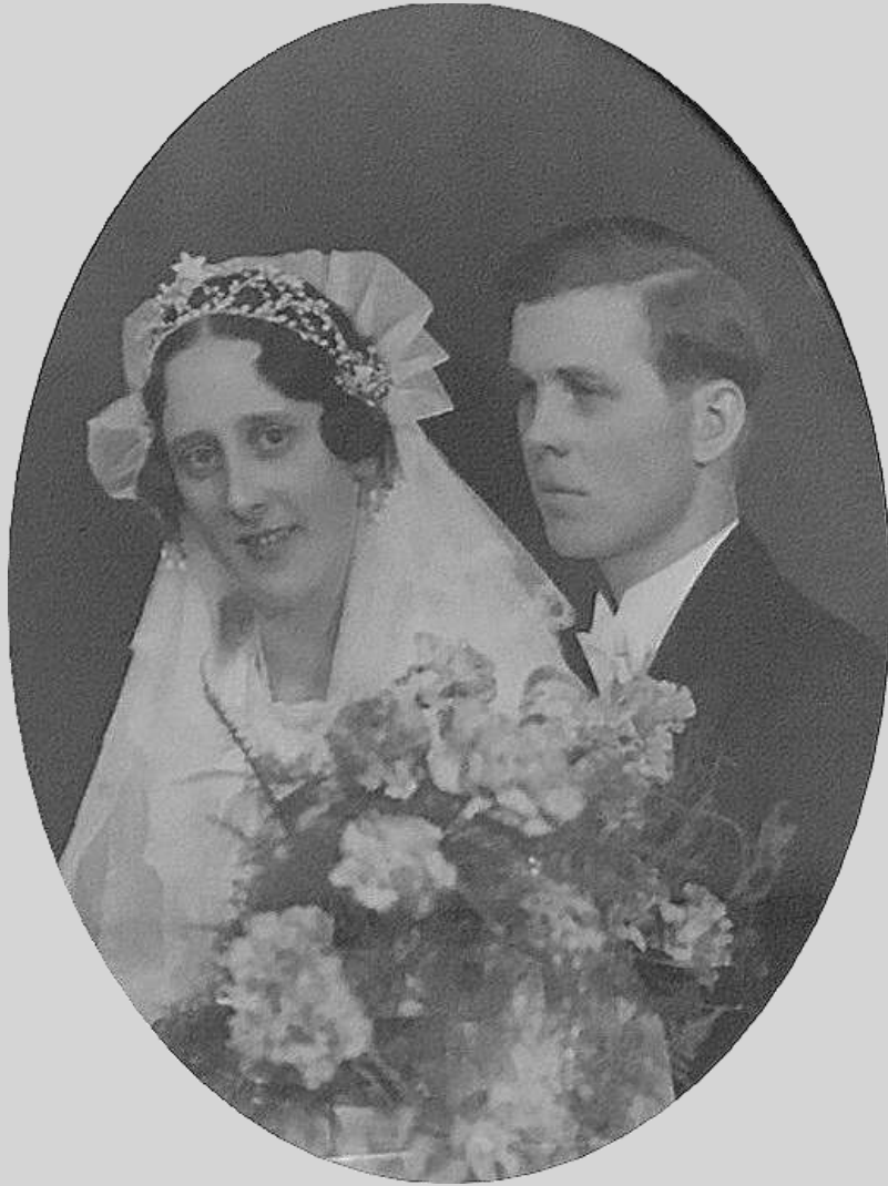
Huvudpersonerna år 1935.