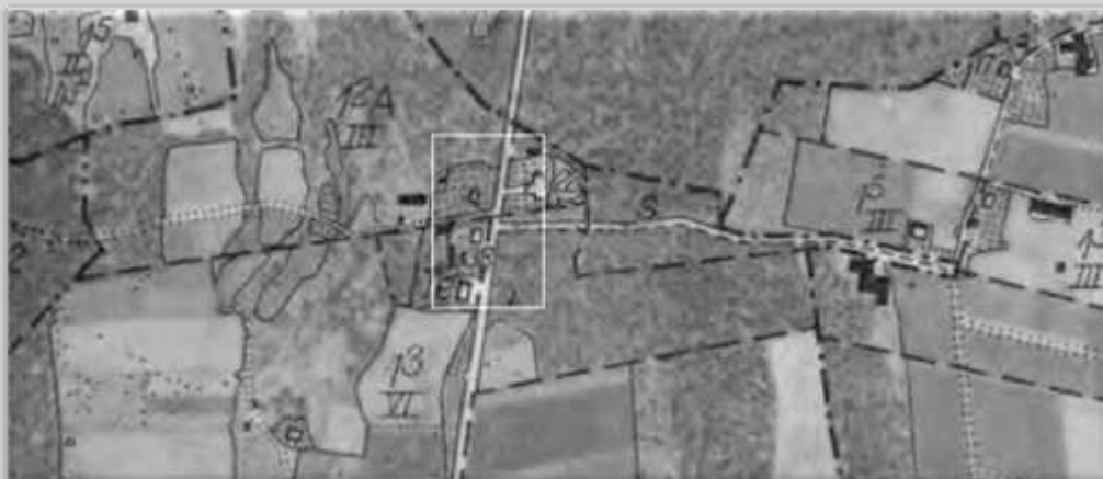
Ekonomiska kartan (1960).