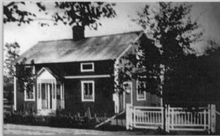
Handelsboden vid vägskälet (1930- talet).