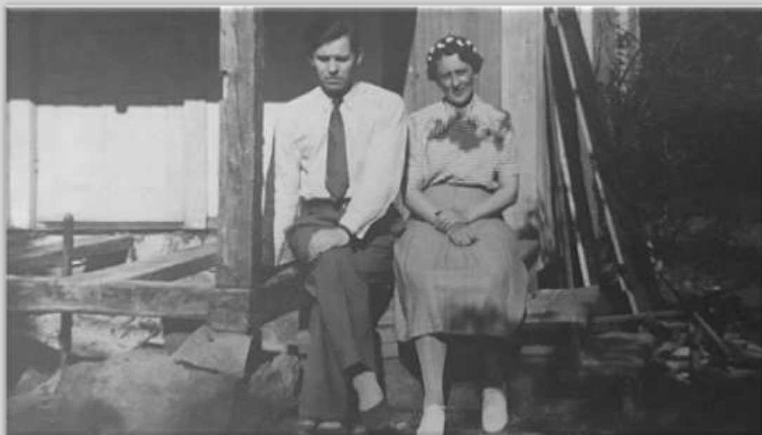
Huvudpersonerna i repris..