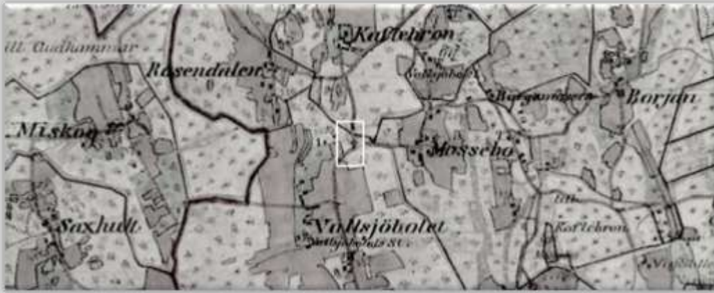
Häradsekonomisk karta (fältmätt 1877- 82).