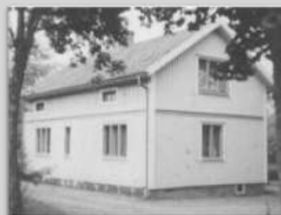
T v: Affär och bostad (Sahlén). T h: Bara bostad (Larsson)..

Se bilderna i sitt sammanhang, sidan 11.