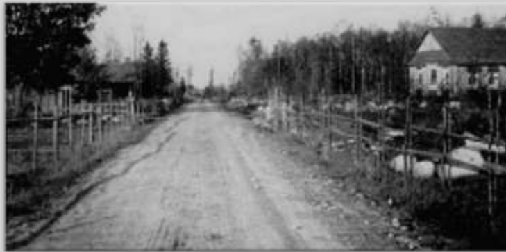
T v: Källstedts. T h: Salemkapellet. (1930- talet).