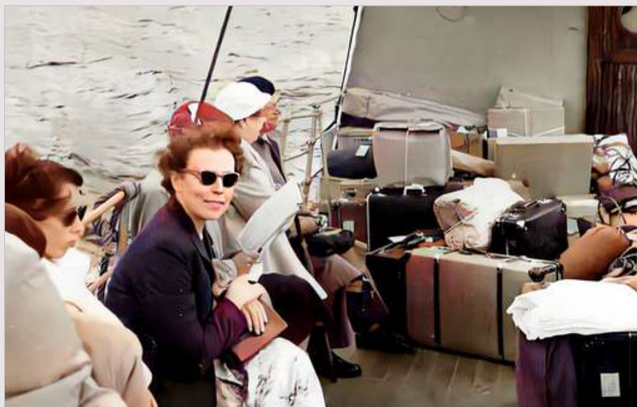
På väg till Brattön i Bohuslän.