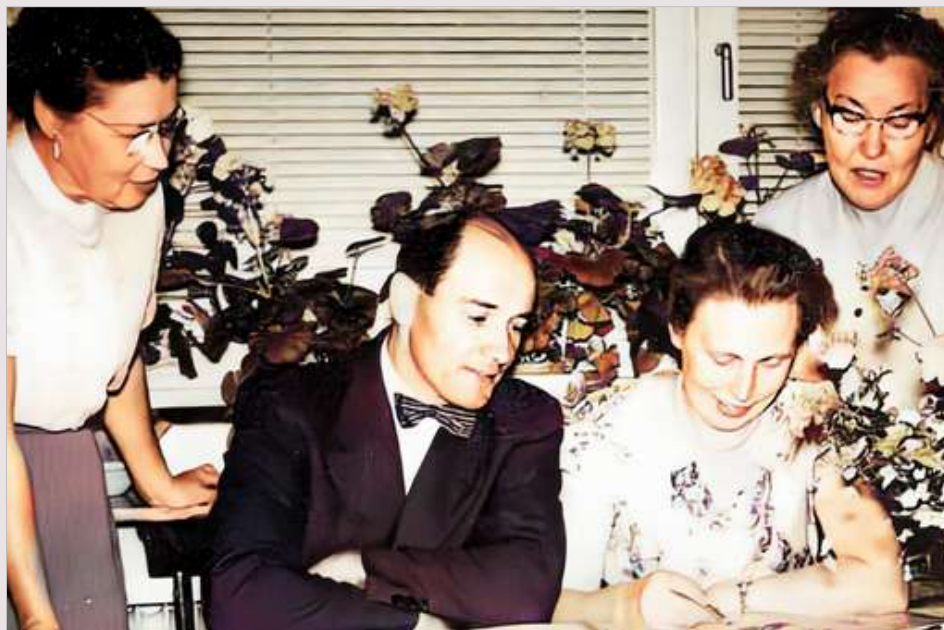
Hos systerna Granath i Falun.