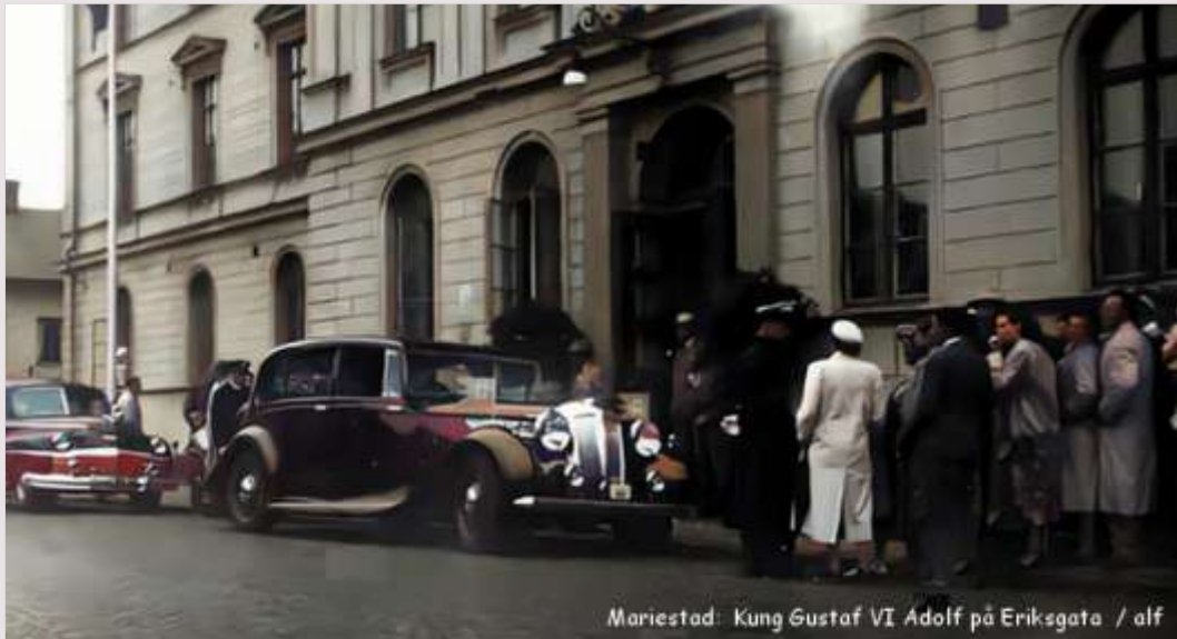
Mariestad: Kung Gustaf VI Adolf på Eriksgata