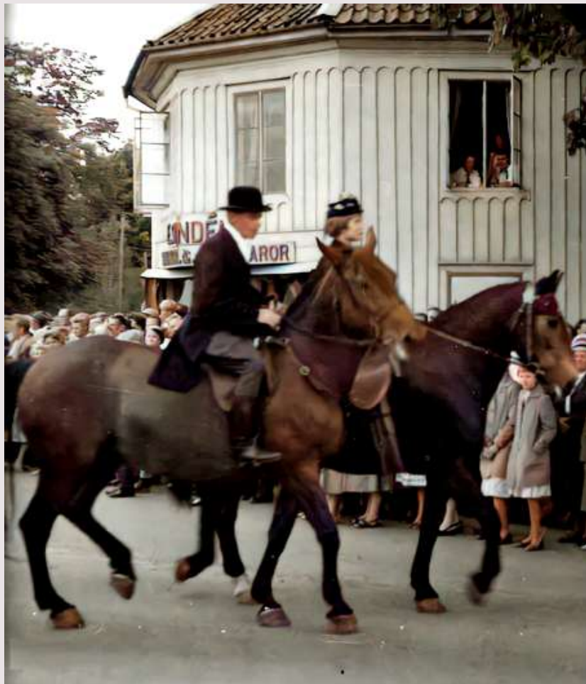
Hantverksmässa i Hova.