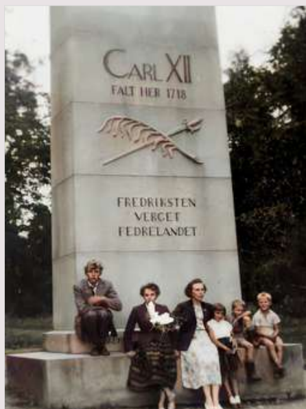
Norge, Norge --- .