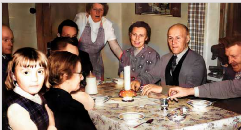
Julafton i Vallsjöbol, med gäster från Mossebo och Karlskoga.