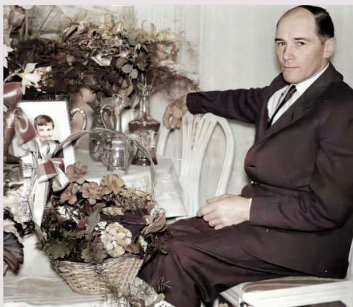
Far fyllde år.

Följer några foton från kommunala och kyrkliga sammanhang: