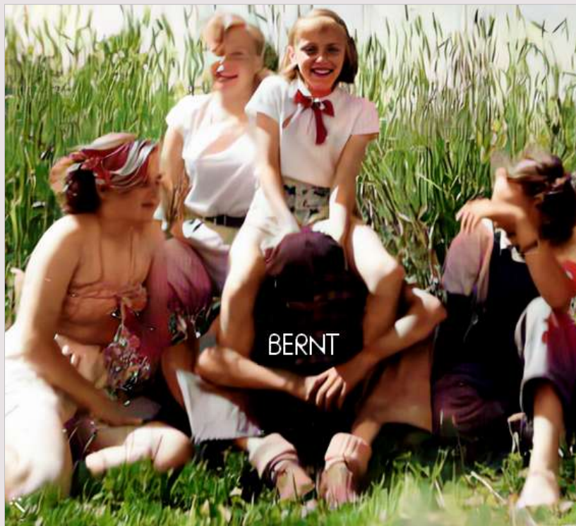
Ja, jag vet inte.