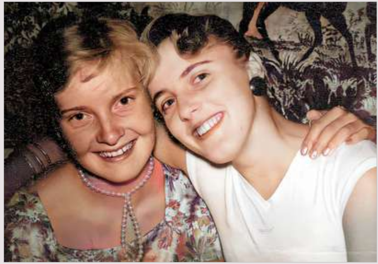
Britt med flera.