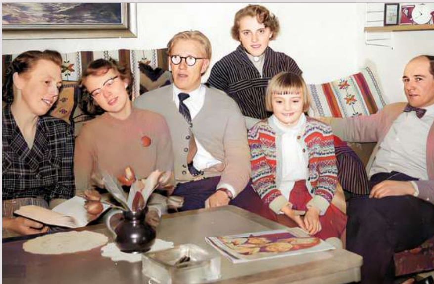
En vikarierande folkskollärare i Vallsjöbol – och hans fru - på kaffebjudning hos skolrådsledamotens familj.