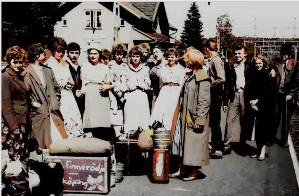
En annan årgång, hemvändande jordgubbsplockare (Finnerödja station).