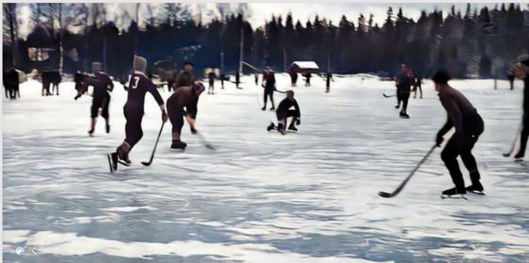
Bandymatch på Åbydammen i Finnerödja (tror jag).