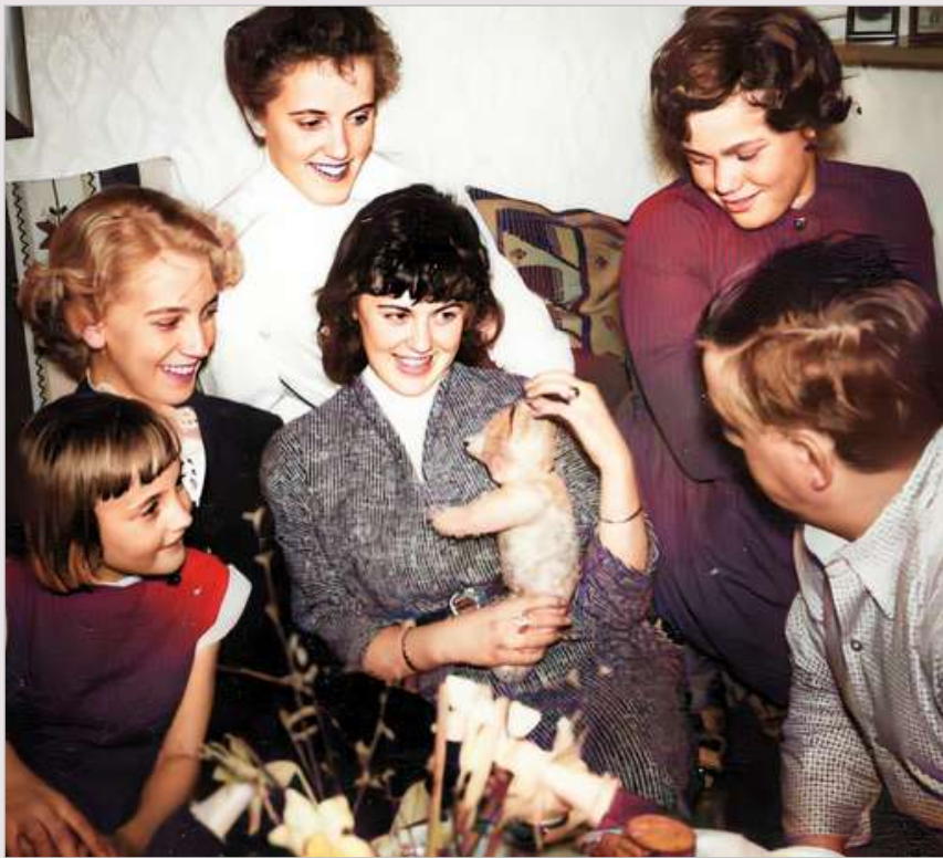
Besök från Gårdsjö/ Alingsås.