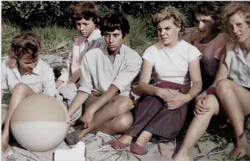
Britt med fem jordgubbsgästarbetare på stranden vid Sandviken. Hjo, hjo.